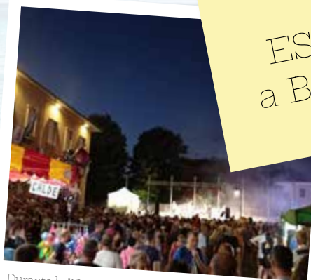
Durante la 'Notte di Mezza Estate' del 20 luglio, le strade e le piazze di Bellusco si sono riempite di grandi e piccini, trasformando la città in un grande palcoscenico di festa