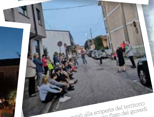
Le camminate serali alla scoperta del territorio con la Pro Loco, appuntamento fisso del giovedì