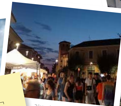
'Notte di Mezza Estate'