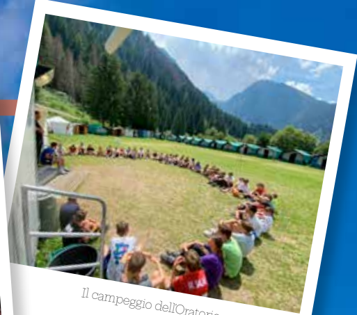
Il campeggio dell'Oratorio