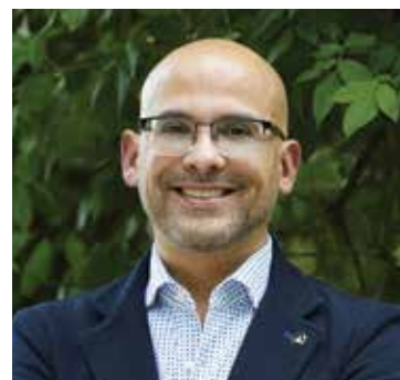
MAURO COLOMBO, SINDACO

Un ringraziamento speciale va al nuovo Consiglio Comunale, composto da persone pronte a lavorare con impegno e passione per il bene della nostra comunità. È solo attraverso il lavoro di squadra e la collaborazione che possiamo affrontare le sfide future e cogliere le opportunità che si presenteranno.