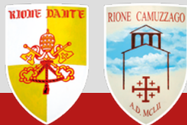
Rioni DANTE e CAMUZZAGO

GLI OPERATORI DI PACE La visione di Isaia: gli uomini trasformano le lance in aratri e le spade in falci (Isaia 2,2-5)