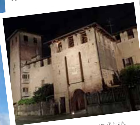
Il castello in una calda notte di luglio