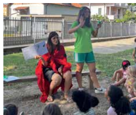
Il Centro Ricreativo Estivo ha accolto più di 100 bambine e bambini dai 3 agli 11 anni