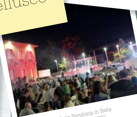
La Fondazione Maria Bambina in festa per il venticinquesimo anniversario