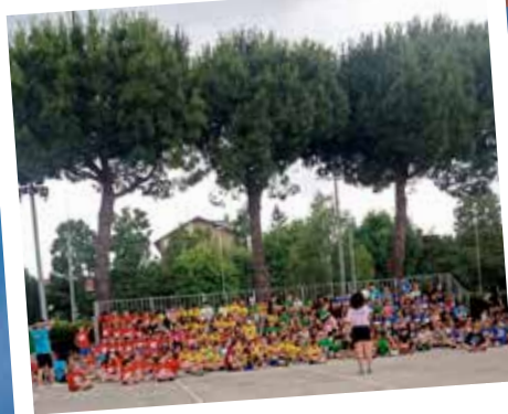
I colori dell'Oratorio Estivo 2024

Questi eventi estivi non hanno rappresentato solo momenti di svago, ma anche preziose opportunità per rafforzare il senso di appartenenza e di identità locale tra i belluschesi. Sono stati momenti di incontro e di condivisione, dove le generazioni si sono mescolate e i legami di amicizia si sono consolidati. In questo modo, l'estate scorsa a Bellusco non è stata solo un periodo di relax, ma anche un momento di crescita e arricchimento personale per tutta la comunità.