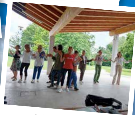
Le danze popolari al parco con la Pro Loco